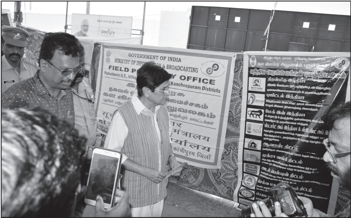
பிரதம மந்திரி திரு.நரேந்திர மோடி தலைமையிலான மத்திய அரசு மூன்று ஆண்டுகள் ஆட்சியை நிறைவு செய்வதையொட்டி நாடு முழுவதும் 300 இடங்களில் “வளர்ச்சி பெற்ற இந்தியாவை உருவாக்குதல்”